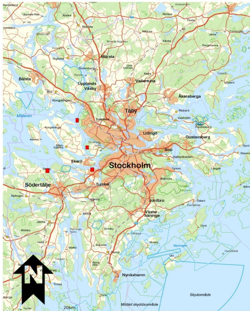
© Länsstyrelsen, Lantmäteriet, NVDB, ESRI Inc, RAA, SGU, Sjöfartsverket, SMHI, SVO, SCB, SIV, FM, Bergsstaten, SLU Skala 1:415300