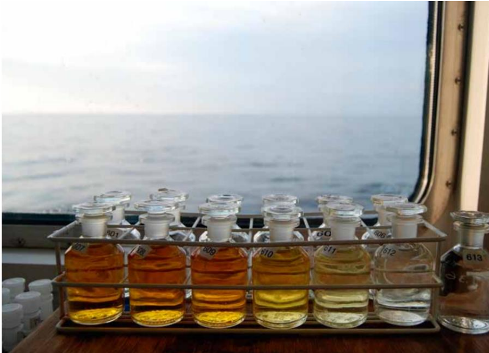
Syreprover från Östra Gotlandshav, som visar gradienten från syresatt (t.v.) till syrefria (t.h.) vatten, sommaren 2013.

Havsmiljödirektivet syftar till nå god miljöstatus i EU:s havsområden, det vill säga att biologisk mångfald bevaras och ekosystemen hålls friska och fria från föroreningar, samtidigt som ett hållbart nyttjande möjliggörs genom att en ekosystembaserad metod för förvaltning av mänskliga aktiviteter tillämpas.