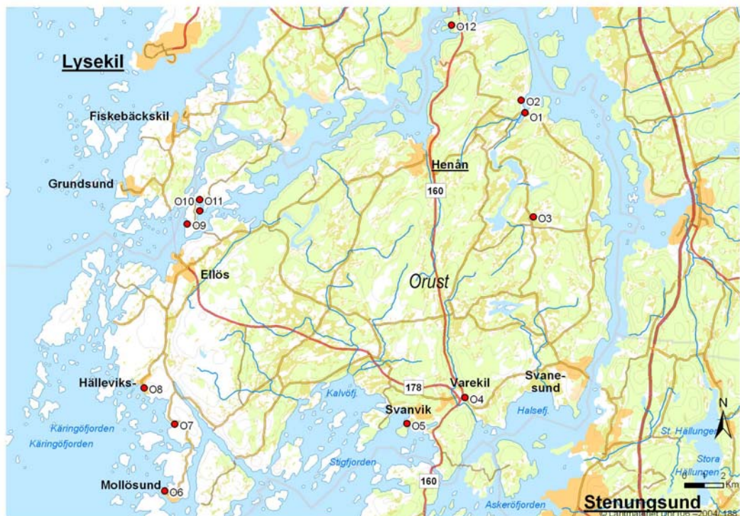
Figur 1. Orust.

Anläggningarna O1-O12 i Orust kommun. Det är för dessa anläggningar utsläppresultat finns dokumenterade i denna rapport. Totalt finns knappt 20 avloppsanläggningar i storleken 26-2000 pe i Orust kommun.