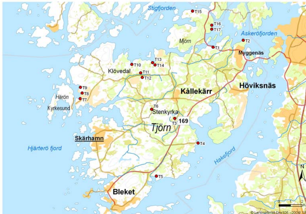
Figur 2. Tjörn.

Anläggningarna T1-T17 i Tjörns kommun. Det är för dessa anläggningar utsläppsresultat finns dokumenterade i denna rapport. Totalt finns ca 30 avloppsanläggningar i storleken 26-2000 pe i Tjörns kommun.