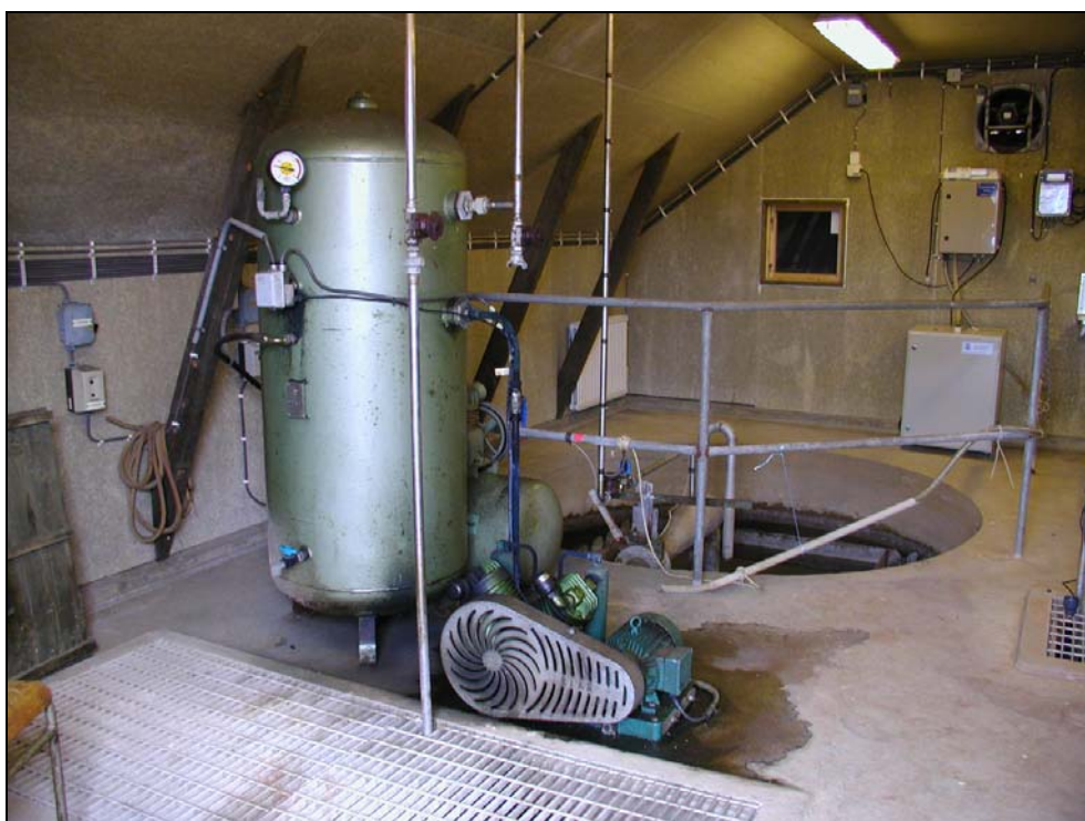
Platsbyggt mekaniskt och kemiskt avloppsreningsverk från 1970-talet. Interiör från våningen över fällningsdammarna. Reningsverket finns på Bö-Ångeviken, Tjörn.