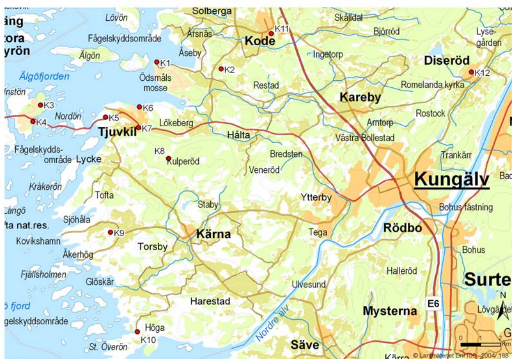
Figur 3. Kungälv.

Anläggningarna K1-K12 i Kungälvs kommun. Det är för dessa anläggningar utsläppsresultat finns dokumenterade i denna rapport. Totalt finns ca 80 avloppsanläggningar i storleken 26-2000 pe i Kungälvs kommun.