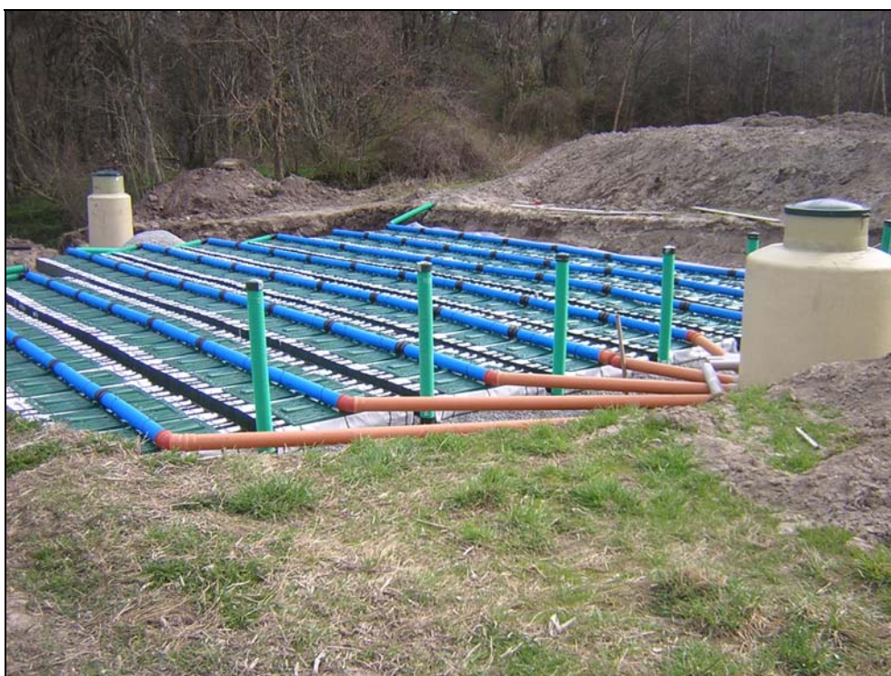
Markädd med moduler, Mölnebo, Tjörn