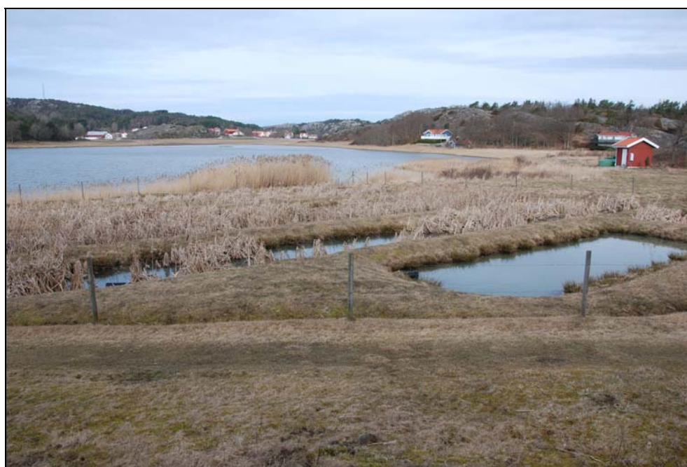
Olsby avloppsreningsverk (i högerkanten på bilden), på Tjörn, med efterföljande våtmark i form av levéer.

1) Anges här som jämförelse mot projektets avloppsreningsanläggningar.