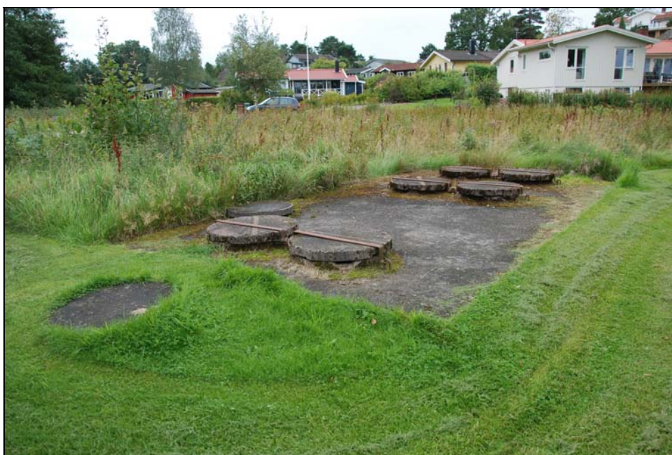
Slamavskiljare tillhörande avloppsreningsanläggning på Ängön, Orust.