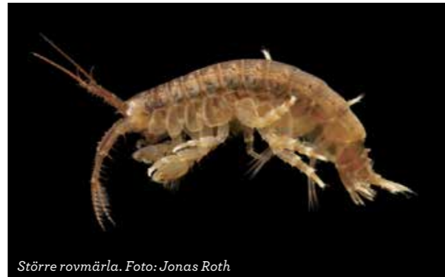
Större rovmärsla.

I denna folder listas några av ”värstingarna” som redan finns i eller nära våra sjöar och som vi inte vill ska spridas till våra sjöar eller spridas inom sjön. Dessa arter är invasiva och några av dem har den högsta riskklassen, det vill säga arter som har stor risk att etablera sig och orsaka stor negativ påverkan på den naturliga faunan och florin. ■