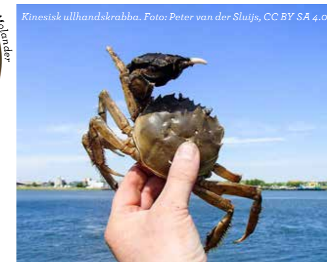
Kinesisk ullhandskrabba.