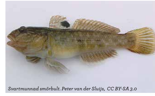
Svartmunnad smörbult.

Ullhandskrabban sprids oavsiktligt och kontinuerligt med fartygens barlastvatten. Första fyndet i Sverige gjordes på 1930-talet. Krabban har stor förmåga att anpassa sig till olika miljöer. Den lever i sötvatten men arten behöver saltvatten för att föröka sig. Krabban kan sprida sjukdomar och parasiter. Där ullhandskrabban finns kan också strandkanter och flodbänkar undermineras då den gräver och bygger gångar. Den kan även orsaka skada för fiske och vattenbruk genom att förstöra redskap och ta fångsten. Kännetecken: Den vuxna ullhandskrabban har ulliga klor och ryggskölden är rundad, max 10 centimeter bred, med ett v-format jack mellan ögonen.