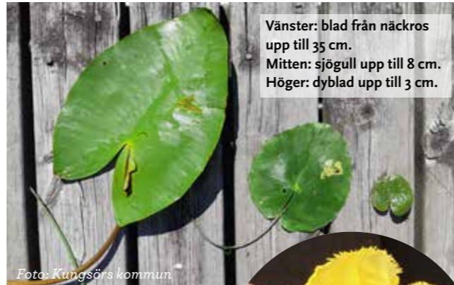
Vänster: blad från näckros upp till 35 cm. Mitten: sjögull upp till 8 cm. Höger: dyblad upp till 3 cm.