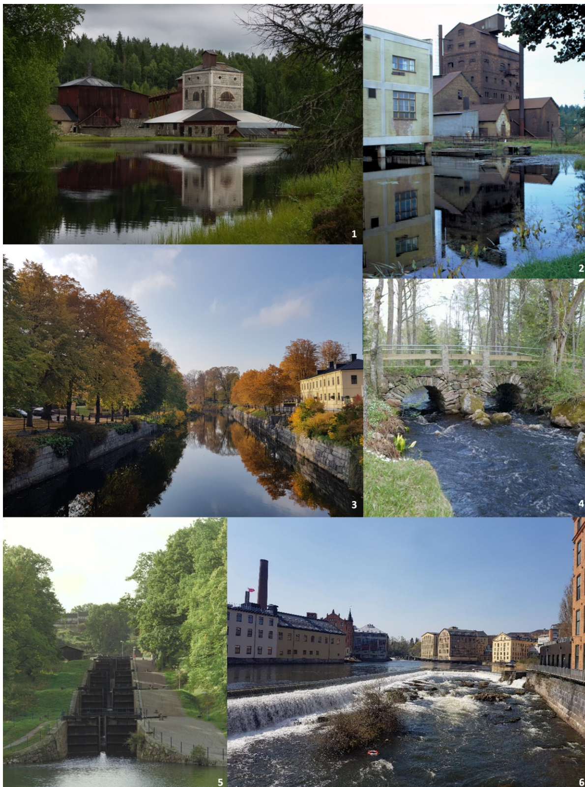
Bilderna visar exempel på kulturmiljöer vid vatten. 1) Bruksmiljö, Svärdsjö kommun, foto Rikard Sohlenius, 2) Bruksmiljö, Laxå kommun, foto Pål-Nils Nilsson, 3) Kajer i urban miljö, Gävle, foto Cissela Génétay, 4) Stenvalvbro, Ljungby kommun, foto Bengt A Lundberg, 5) Sluss, Trollhättans kommun, foto Gabriel Hildebrand, 6) Dammar, kajer och industrier i urban miljö, Norrköping, foto Cissela Génétay. Alla foton CCBY.