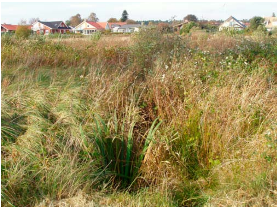
Figur 6. Arten är känslig för igenväxning, här syns det numera igenväxta diket på den gamla lokalen vid Längenäs (lokal 1 i tabell 1) vid där murgrönsmöja senast sågs i början av 1980-talet.

Arten är mycket konkurrenssvag och försvinner snabbt från igenväxande lokaler där betet har upphört (Georgson 2000). Såväl skuggning från träd och buskar som konkurrens från expansiva arter i fältskiktet är negativt för arten. Bete som håller nere konkurrerande vegetation, och tramp från kreatur gynnar arten genom att minska konkurrensen och skapa öppna ytor där den kan breda ut sig och där nyetablering kan ske. Transport med betesdjur kan förmodas vara en viktig faktor för spridning av arten mellan närliggande vattensystem.