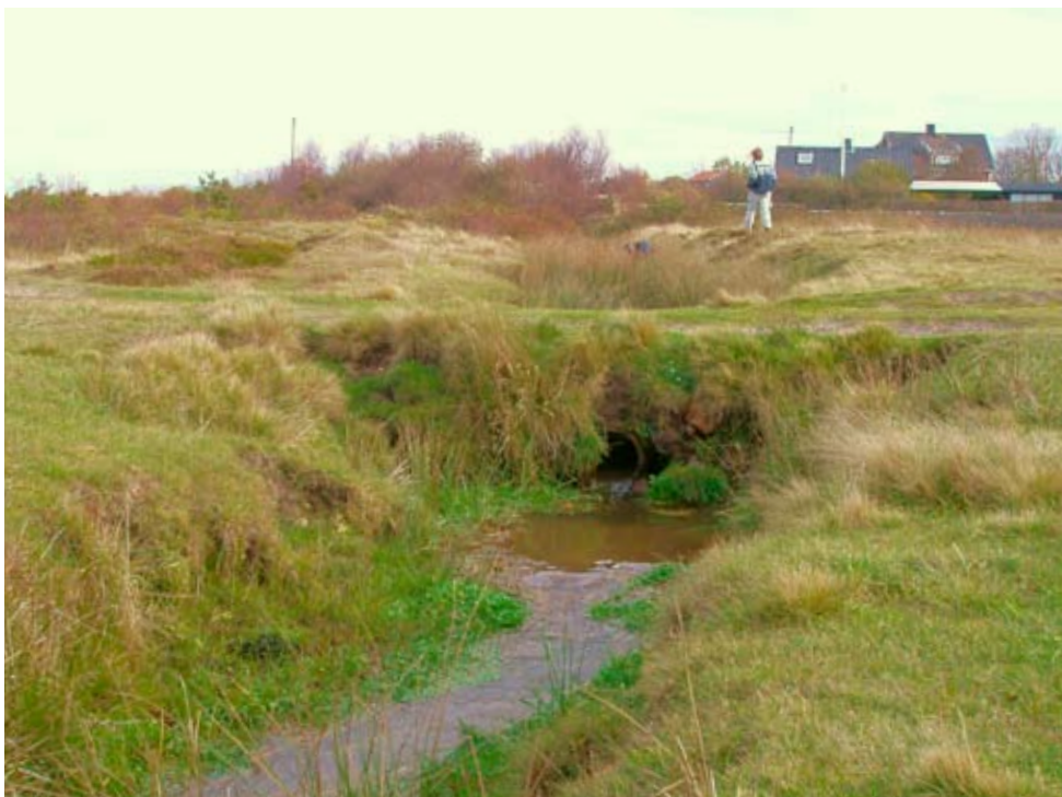
Figur 4. Bäcker är en annan viktig livsmiljö. Här syns murgrönsmöja längs bäckkanten på lokalen Särdal N om Törnehall (lokal 5 i tabell 1).