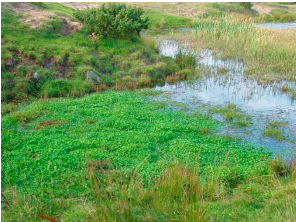
Figur 3. Källflöden är en av artens livsmiljöer. Här syns en matta av murgrönsmöja vid Särdal SO om Törnehall (lokal 4 i tabell 1) där ett källflöde mynnar i en damm.