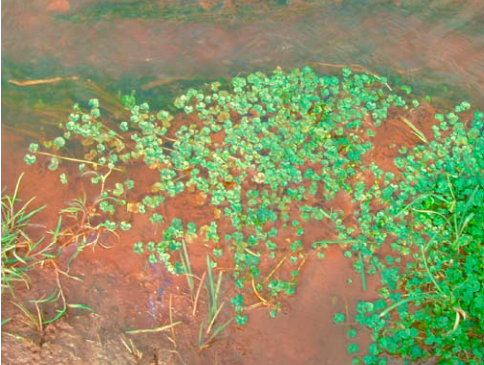
Figur 2. Murgrönsmöja, Ranunculus hederaceus på håll, växande i kanten av bäcken på lokalen Särda N om Törnehall (lokal 5 i tabell 1).