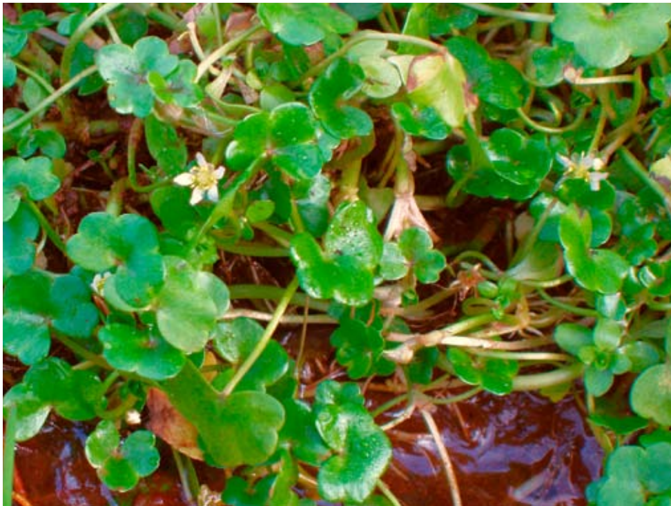
Figur 1. Murgrönsmöja, Ranunculus hederaceus .

Murgrönsmöja, Ranunculus hederaceus , är en under gynnsamma förhållanden mattbildande vattenväxt med upp till 50 cm långa, slankiga, kala, nedliggande och rotsläende stjälkar (Figur 1). De flesta möjor har trådflikiga undervattensblad men sådana saknas helt hos murgrönsmöja. Arten har bara en typ av blad och dessa fungerar som flytblad i vatten och som terrestra blad när den växer på fuktig mark. Bladen är ganska styva, 0,5–2 cm breda och njurlika med 3–5 breda flikar och påminner till formen om bladen hos murgröna ( Hedera helix ). Denna likhet har gett växten både dess svenska och latinska namn ( hederaceus = murgrönsliknande). Blommorna är vita, 4–7 mm breda och med smala kronblad som är föga längre än foderbladen. Blommorna sitter en och en på skaft som utgår mittemot bladvecken. Frukterna är kala och sitter i en nästan klotrund samling på ett kort, svagt krökt skaft. Vid fruktmognaden böjer sig skaftet ner i det underliggande substratet. (Hartman 1854, Aichele & Schwegler 1992, Krok & Almquist 1994, Nilsson 1995, Georgson et al. 1997, Georgson 2000, Mossberg & Stenberg 2003, Anderberg & Anderberg 2004).